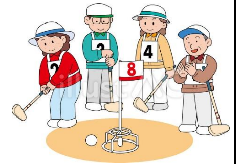
グラウンドゴルフ（随時）