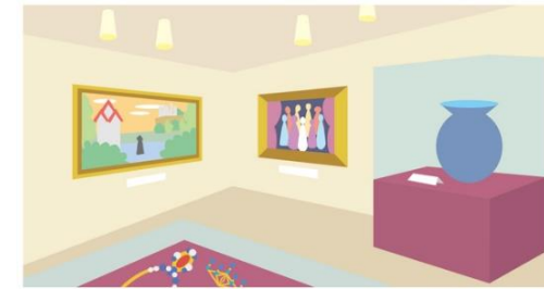
美術展・アート展（1回/年）