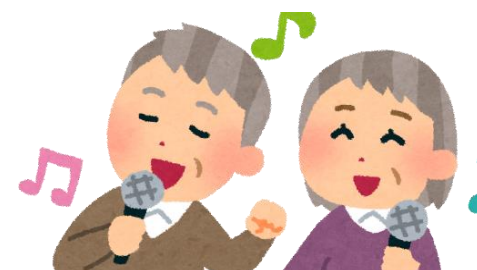
カラオケ（第1・3水曜日）