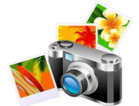
写真（1回/月）・写真展を開催