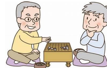
囲碁（健保会館・さつき館）